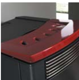
BORDEAUX (AVEC CRAQUELURES) BORDEAUX (MIT HAARRISSEN)