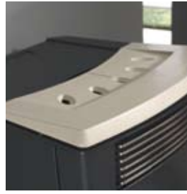
POIVRE-ET-SEL SALZ UND PFEFFER