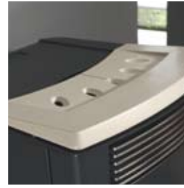
POIVRE-ET-SEL SALZ UND PFEFFER