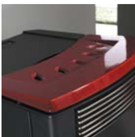
CÉRAMIQUE BORDEAUX (AVEC CRAQUELURES) BORDEAUXFARBENE KERAMIK (MIT HAARRISSEN)